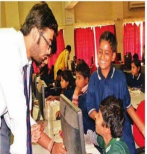
बच्चों के बच्चों के जीवन में शिक्षा की मुस्कान लाने समूह के सदस्य।

मुस्कान मुझ रूप से जलिया छात्रों द्वारा शुरू किया गया था जो इसी तर्ज पर काम करता। यह समूह विस्तार वह सफलतापूर्वक संघनित हो तो हैकडों बच्चों को साबर बनाने अपना अहम योगदान दे रहा है। इसी तरह इंदौर के छात्रों ने उ शहर के निरक्षर बच्चों के लिए अपनी डिमण्डरी को समझते ऐसे बच्चों को ढूंढने शुरू किया जिन्होंने अब तक स्कूल का नहीं देखा व फिर वे किसी भी कारण से अपने पढ़ाई जारी रख पा रहे हैं। ऐसे बच्चों को शिक्षा देने बड़ी चुनौती थी, लेकिन 21वीं सदी के युवाओं के लिए भी तकनीकी नहीं है। इसी तरह लेकर युवा छात्रों ने शहर के अलग-अलग इलाकों और विभिन्न क्षेत्रों में जाकर सर्वे करना शुरू किया। इसके लिए बकायदा अलग टीम बनाई गई, जिन्होंने अपना काम बड़ी ईमानदारी के साथ किया और करीब 85 से ज़्यादा को ढूंढ निकाला, जिन्हें समूह शिक्षा की उत्तर देती।